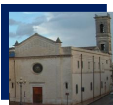
Parrocchia SS. Annunziata